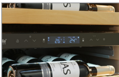
Termostato elettronico Electronic thermostat