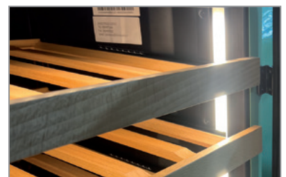
Mensole in legno ad estrazione Wooden shelves with sliding system