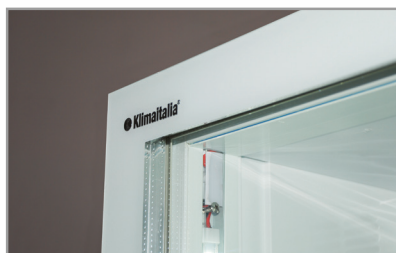
Porta a sfioro senza cornice Full glass frameless door

Dati indicativi e variabili a seconda dei diversi packaging / Variable data depending on the different packaging