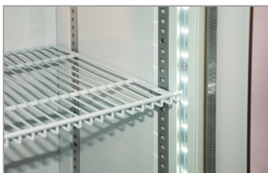
Luci led Led lighting