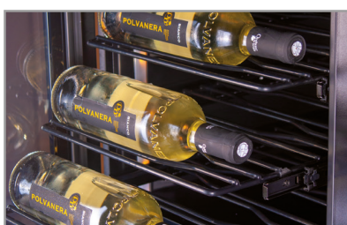
Mensole in metallo ad estrazione Metallic shelves with sliding system