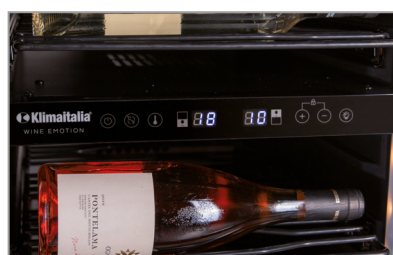
Termostato elettronico Electronic thermostat