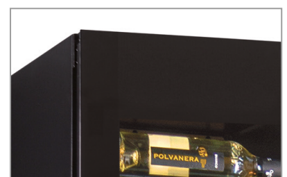
Porta a sfioro senza cornice Full glass frameless door