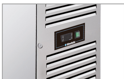
Termostato elettronico Electronic thermostat