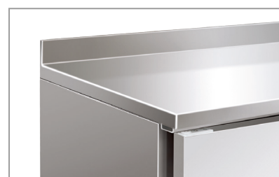
Superficie esterna in acciaio inox Stainless steel body