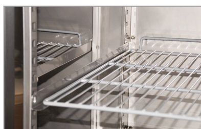
Mensole a scorrimento Sliding shelves