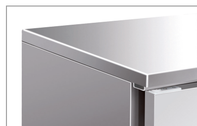
Superficie esterna in acciaio inox Stainless steel body