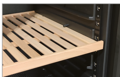
Mensole in legno - Optional (lato vini) Wooden shelves - Optional (wine side)