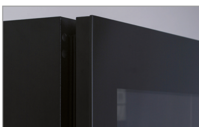
Porta a sfioro senza cornice Full glass frameless door