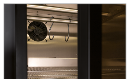
Barre per appendimento Hanging bar