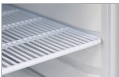
Mensole rinforzate (versione TN) Reinforced shelves (TN model)