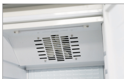
Ventola assiale Axial fan