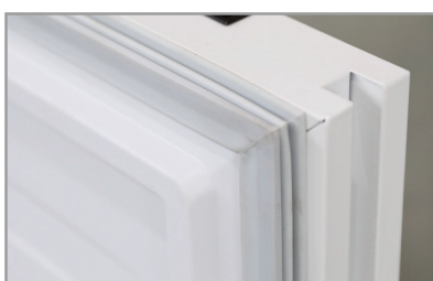
Maniglia integrata Built-in handle