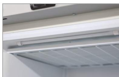
Illuminazione LED LED lighting