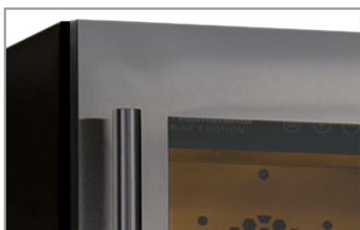
Porta in acciaio (DW 190 SILVER) Stainless steel door (DW 190 SILVER)