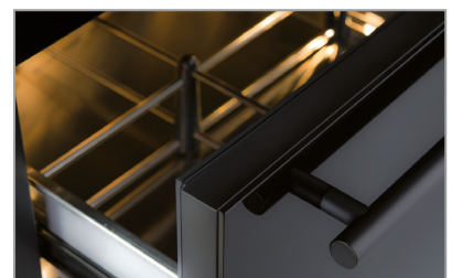
Cassetti con separatori Drawers with separators