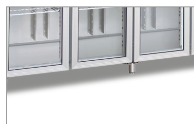
Porte in vetro (Versioni TNG) Glass doors (TNG versions)