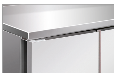
Superficie interna ed esterna acciaio inox Stainless steel body and inner liner