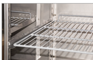
Mensole a scorrimento Sliding shelves