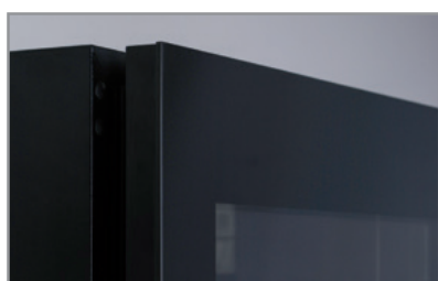
Porta a sfioro senza cornice Full glass frameless door

Dati indicativi e variabili a seconda dei diversi packaging / Variable data depending on the different packaging