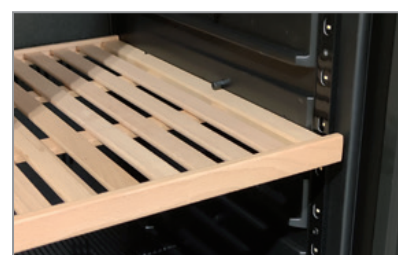
Mensole in legno - Optional Wooden shelves - Optional