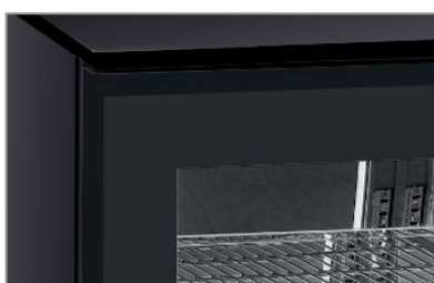
Porta senza cornice con maniglia integrata Full glass frameless door with integrated handle