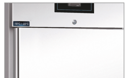
Chiave e serratura Lock and key