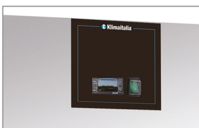
Termostato elettronico Electronic thermostat