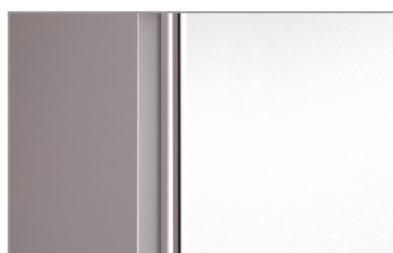
Maniglia integrata Built-in handle