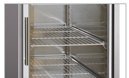
Porta vetro - Modelli TNG/BTG Glass door - TNG/BTG model