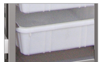
Vaschette in plastica Plastic baskets