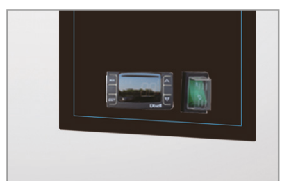
Termostato elettronico Electronic thermostat

Armadio Gastronorm pescheria statico. Gastronorm fish cabinet.