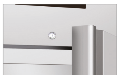
Chiave e serratura Lock and key