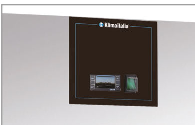
Termostato elettronico Electronic thermostat