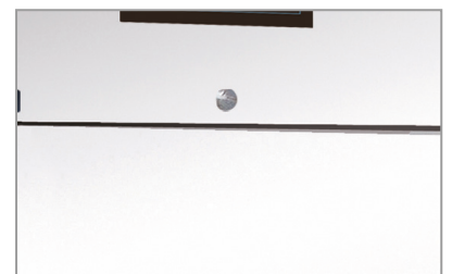
Chiave e serratura Lock and key