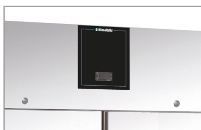
Termostato elettronico Electronic thermostat