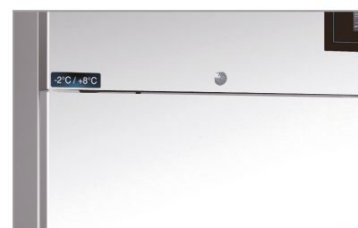
Chiave e serratura Lock and key