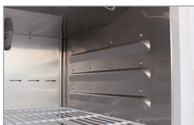
Lamiera interna stampata Thermoformed stainless steel innerliner