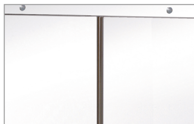
Maniglia integrata Built-in handle