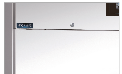
Chiave e serratura Lock and key