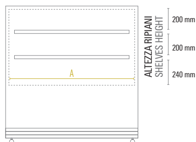
DELUXE 92/122/152 PSV FRONTE / FRONT